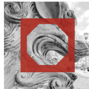
D. 住房、健康、社会意义